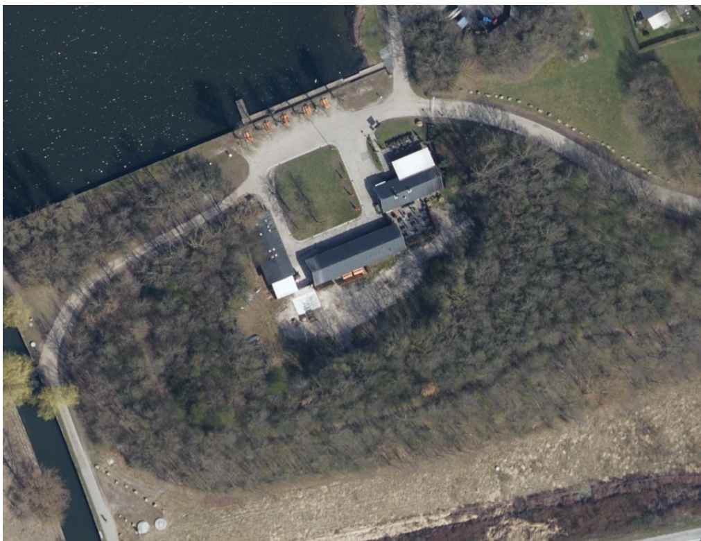
Luftfoto af Rendsagervej 5